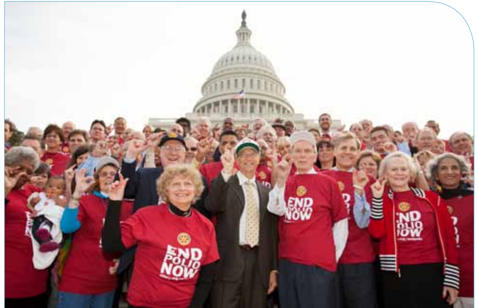
Bill Gates, copresidente de la Fundación Bill y Melinda Gates, y un grupo de rotarios posan haciendo el gesto de la campaña "Solo esto" en la escalinata del capitolio de Estados Unidos el pasado 24 de octubre, Día Mundial de la Lucha contra la Polio. La campaña "Solo esto" promueve el mensaje de Rotary End Polio Now .

Alcanzar la marca de 200 millones de dólares representa un hito de capital importancia, pero el objetivo final es la certificación de la erradicación de la polio, para lo cual se necesitarán fondos adicionales. Sigue existiendo un importante déficit de financiación para cubrir las futuras actividades de inmunización. Las naciones contribuyentes deberán desempeñar un papel fundamental para subsanar dicho déficit y los rotarios deberán continuar desempeñando su labor de concienciación ante sus gobiernos. Asimismo, es fundamental que los rotarios continúen apoyando el Desafío de Rotary hasta el 30 de junio de 2012.